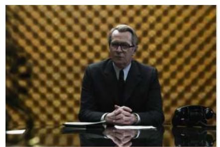
『裏切りのサーカス』Tinker Tailor Soldier Spy http://uragiri.gaga.ne.jp/

世界を変えたのは、妻であり、母であり、ひとりの女性だった。 アカデミー賞女優メル・ストリープが全身全霊で挑む、＜鉄の女＞マーガレット・サッチャーの真実。