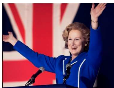
『マーガレット・サッチャー 鉄の女の涙』 http://ironlady.gaga.ne.jp/

本年度アカデミー賞、堂々10部門ノミネート！ 1920年代のハリウッドを舞台に、白黒&サイレントで描き上げる感動のラブストーリーに、世界が喝采！ 映画、そして人生への溢れんばかりの愛を、あなたにお届けします——。