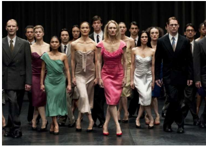
『Pina/ピナ・パウシュ 踊り続けるいのち』